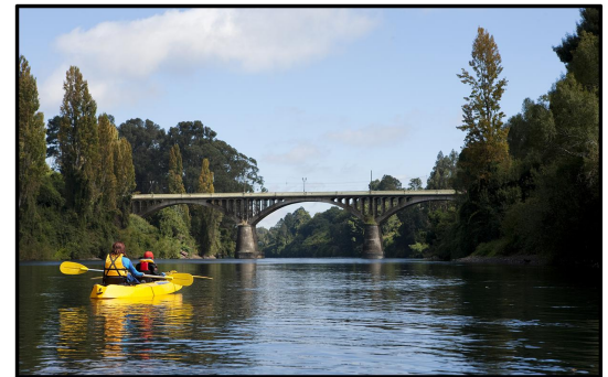
Puente Río Bueno