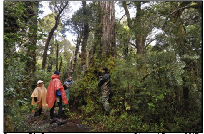
Bosque Río Bueno (Diario el Ranco, 2015)