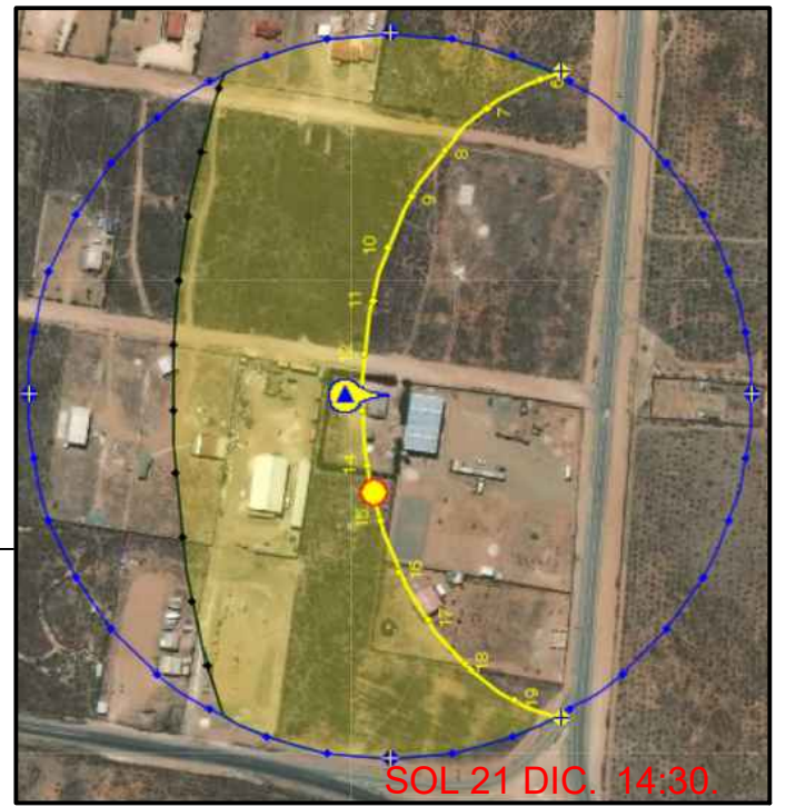
Cálculo de la posición del sol

La casa está dispuesta de modo que la fachada oeste, lugar hacia donde se encuentra ubicado el living comedor y la entrada principal, apunta en dirección al cerro Guanaqueros, que protege del viento directo de la costa.