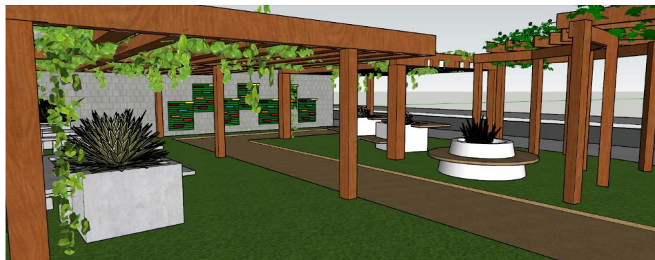
Fuente: Elaboración Propia en Sketchup