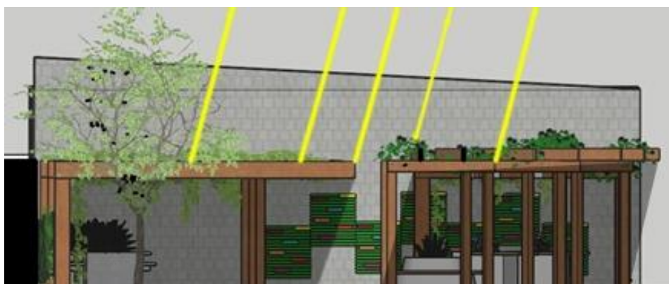
Fuente: Elaboración Propia. Hecho en Sketchup y Photoshop